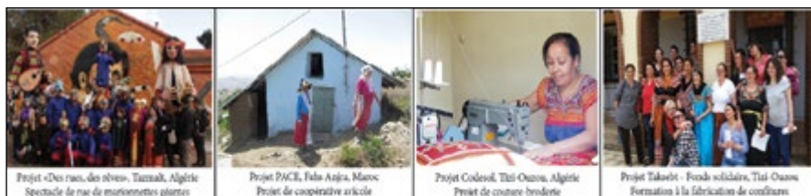
Projet «Des rues, des rêves», Tazmalt, Algérie Spectacle de rue de marionnettes géantes